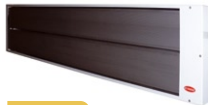
GFH 2000, 2600