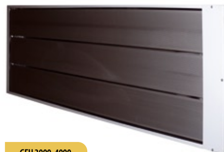
GFH 3000, 4000