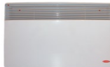
primero 2000 MW