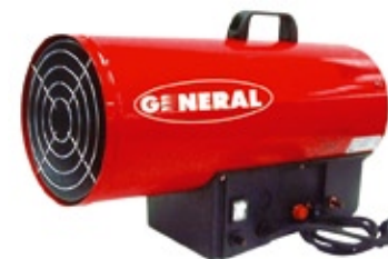
K2C-G 250 A