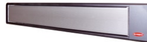
GFH 1100, 1400