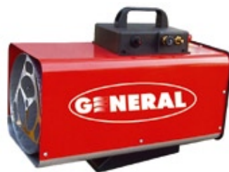
Grisou 25 R