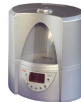
Ультразвуковые увлажнители воздуха

Представлено 2 вида тепловентиляторов: спиральные и керамические. Керамические тепловентиляторы благодаря низкой температуре нагревательного элемента (керамические пластины) «не сжигают» кислород, очень надежны и долговечны.